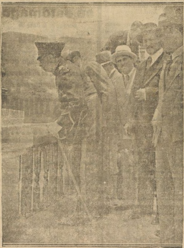
Ceremonia de inusitada trascendencia para la vida de dos países hispanoamericanos: Venezuela y Colombia. Se inaugurará la unión de las carreteras transversales que por primera vez en la historia de las comunicaciones une a las dos Naciones vecinas.

Tal empresa, formidable por la importancia de las obras precisadas para dominar la naturaleza del vasto territorio, es debida al general don Juan Vicente Gómez, Presidente de los Estados Unidos de Venezuela que desde el año 1908 dirige los destinos nacionales de aquel país.