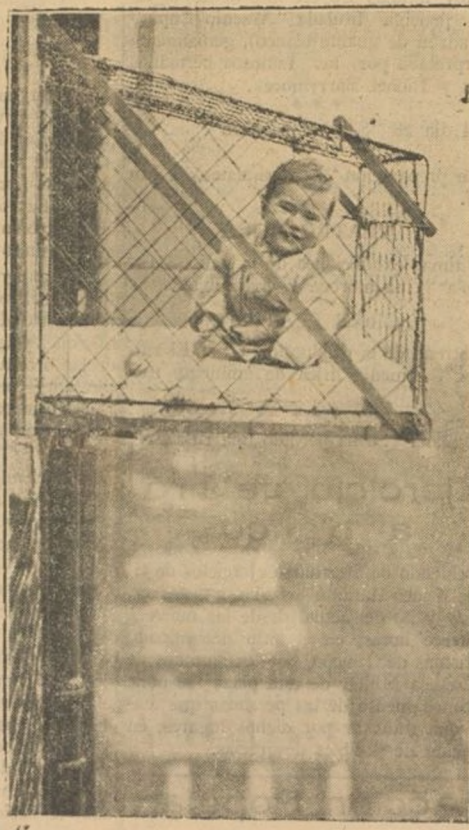
Ved a este niño sacado al sol—como un pajarito en su jaula—para bien de su salud y tranquilidad de su madre.