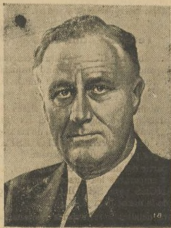
Roosevelt, el actual presidente de los Estados Unidos, que cuando ocupó la presidencia "solo" encontró 19.688 millonarios, ve como poco a poco va disminuyendo en su país el número de "desgraciados".

rio Arthur Butler, que se suicidó ante el magnífico palacio de su propiedad en San Francisco. Había debutado como simple dependiente de tienda; después llegó a ser banquero y entusiasta admirador de las artes. Fue esposo de la más linda mujer de los Estados Unidos. En su bolsillo se encontró la siguiente carta: "Habiendo conocido todas las grandes sensaciones hu-