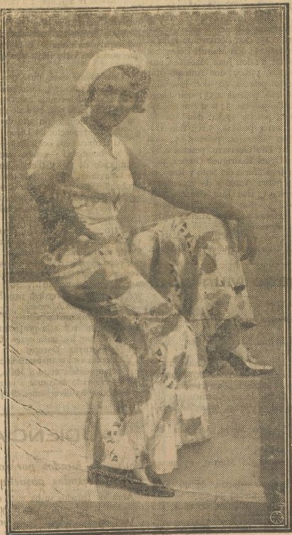
ANITA LASALLE es una de las vedettes españolas de más prestigio y que cuenta, mercedemente, con mayor número de admiradores; lo que no puede extrañar conociendo las cualidades que caracterizan a la notable intérprete del frívolo género varietal. Además, Anita Lasalle posee una sugestiva originalidad como inventora de vestidos-deshabillés según puede observarse en esta pose luciendo un traje de marinero ultramoderno.