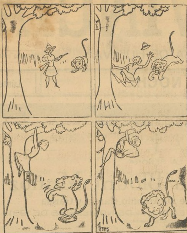
Historieta sin palabras.

sin temor alguno practican toda clase de intempestivas maniobras en el tratamiento de las fracturas o luxaciones de los huesos largos. Todos ellos, unen a la responsabilidad evidente de los que administran aguas milagrosas, la indiscutible responsabilidad activa que realiza un daño irreparable en la mayoría de los casos, unas veces engañando al paciente al hacerle creer en su supuesta "gracia" y otras con la práctica de maniobras torpes e inconsistentes, que imposibilitan una acertada actuación ulterior.