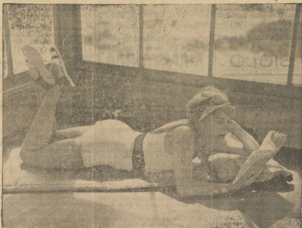
WINNE GIBSON, descansa de las fatigosas jornadas de los estudios de Hollywood consagrados a la lectura de sus libros predilectos, que son todos los que tratan de deportismo y su avanzada, el nudismo o el maillottismo.