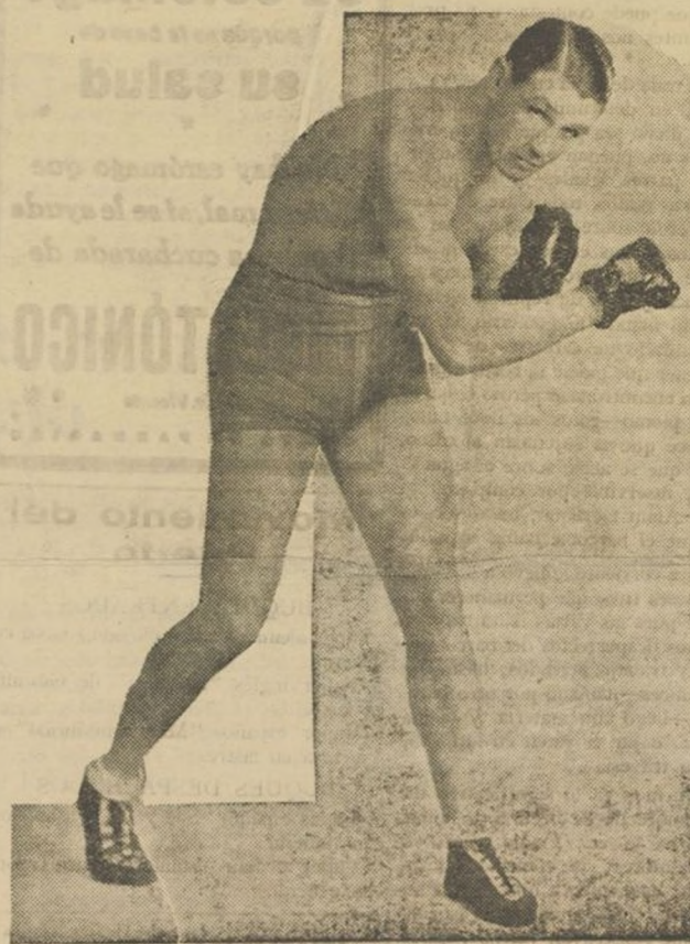
ISIDORO GASTAÑAGA, as del boxeo que viene cosechando innumerables éxitos en los rings de todos los países.