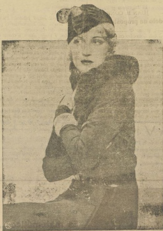
He aquí una elegante "tenue" de invierno firmada por un afamado modisto parisién