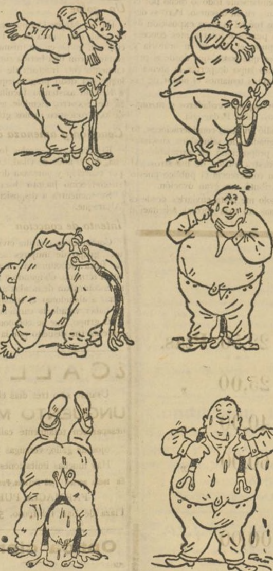
Como se inventó la gimnasia sueca