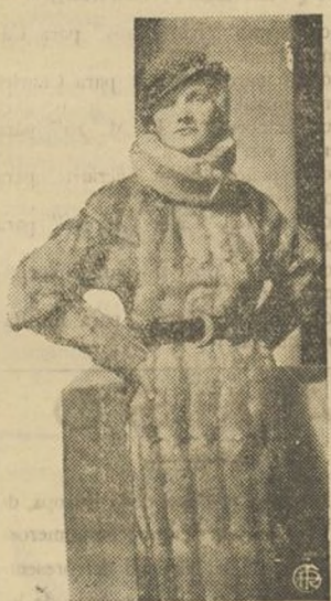
Modelo de abrigo de piel de última moda.

ayuntando con bromas el propio temor al mal presagio.