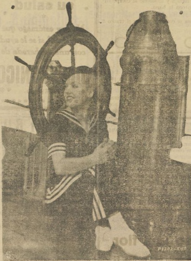
CAROLE LOMBARD, la bellísima y notable estrella de Cinelandia, desde hace algún tiempo está inundando el mundo de fotos marinas. Como puede verse hace una timonela muy estimable y sugestiva para la navegación de altura.