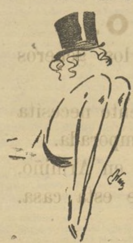
El último retrato de Marieno Dietrich.

La genial interprete de "Fatalidad" y "El Expreso de Shanghai" que impuso en