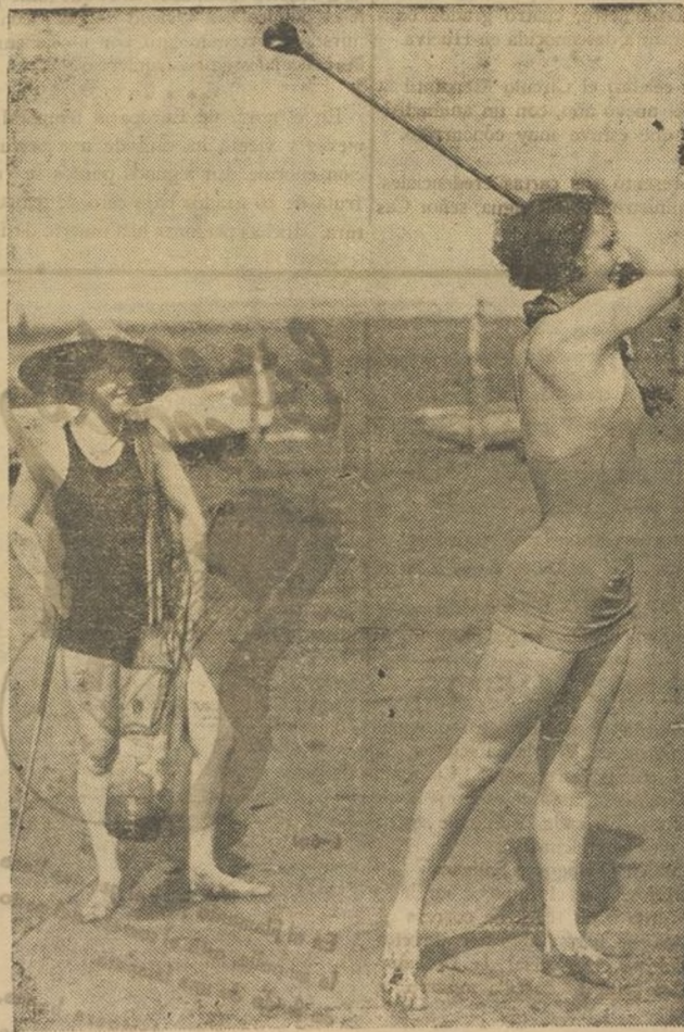
No podrá negarse que tiene sus atractivos el británico deporte. Conserva la línea, da flexibilidad, reconforta el ánimo... pero se necesita una buena maestra.