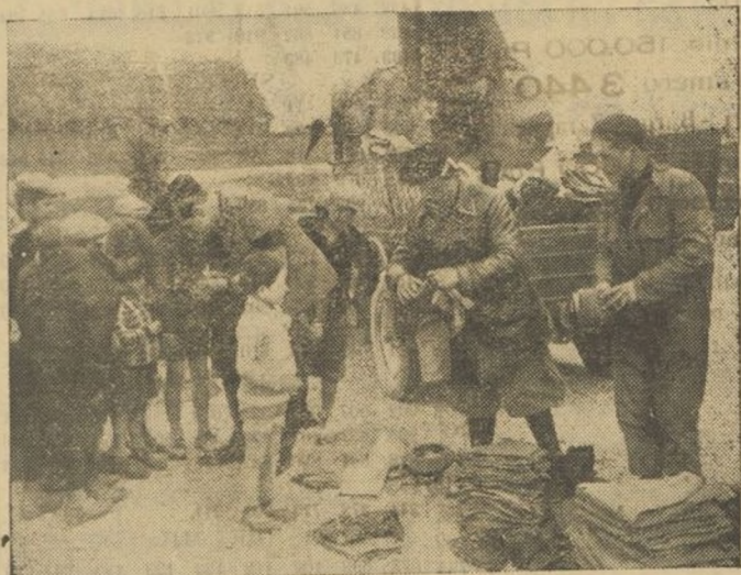
En la nueva ciudad de Littoria, (Italia) la Asociación general de Balillas ha procedido a repartir ropas y uniformes a los hijos de todos los colonos de residentes en aquella población con motivo de las fiestas de Pascuas.