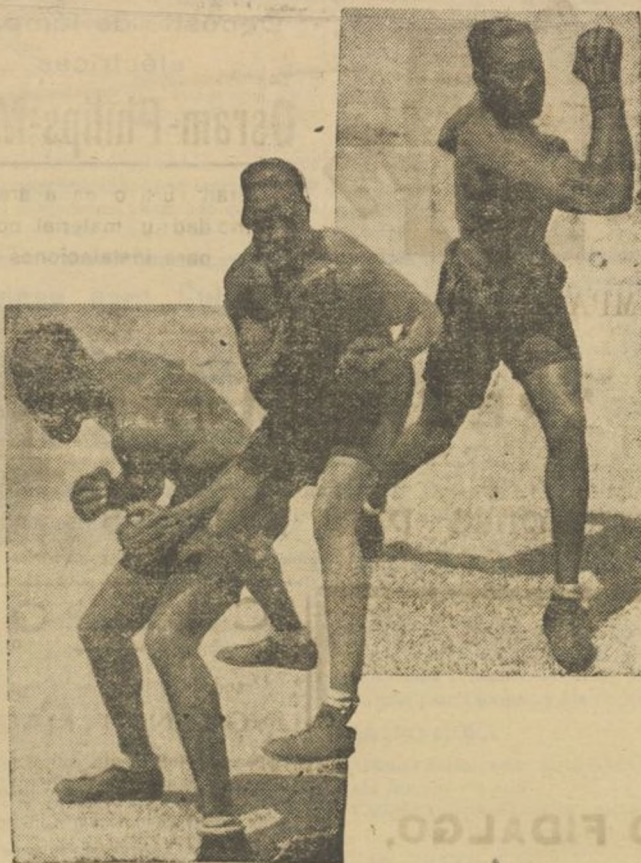
El medio mediano Joe Roly, campeón cubano, que está conquistando unas concluyentes victorias. Roly muestra en esta "foto" algunas de sus principales actitudes, que no están exentas de elegancia y perfecto conocimiento de la pose.