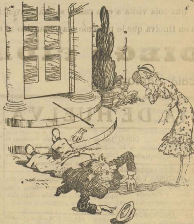
—Esta es la tercera vez que vengo a pedirte tu mano a ti may manera de que me digas si o no.