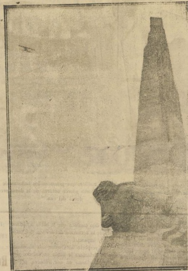
Perspectiva del monumento erigido en los acantilados de Etretat, frente al Mar del Norte, en memoria de los gloriosos aviadores Nungesser y Coli, desaparecidos al intentar la travesía del Atlántico.