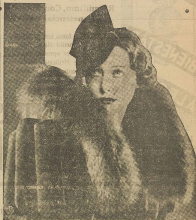
He aquí a una linda modelo de una firma parisina, luciendo un sombrero y cuello de abrigo, última de sus creaciones.