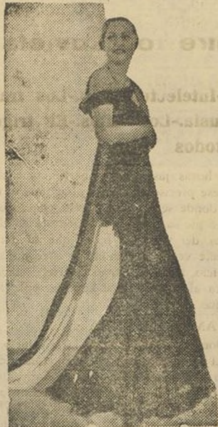
Modelo de traje de "soirée".

vestidos de muselina bordado. Pero ahora pasa a ser algo más: la tela predilecta por ellas, ya no sólo para un fin de adornos, sino para prendas de verdadera importancia.