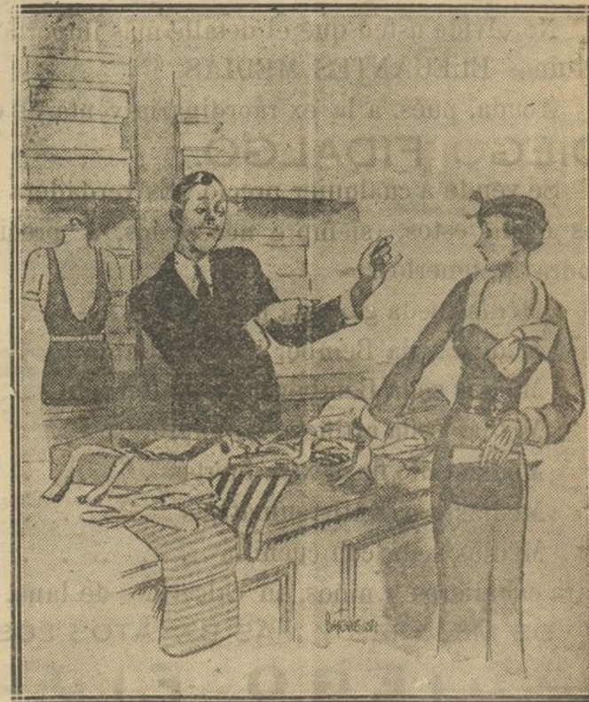
El dependiente (que ha enseñado ya todos los modelos de trajes de baño que hay en la tienda).—Como lo que usted quiere es un traje para tomar baños de sol, yo creo que lo más a propósito es este.

VEA MAÑANA NUESTRA SECCION “PARA LA MUJER”