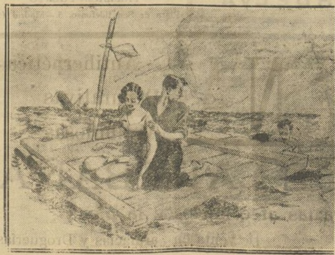
Maldita sea mi suerte! ¡Un polizón!