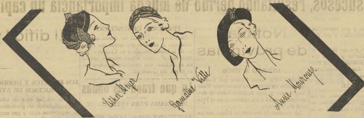
Toca de paja negra, con adorno de cinta verde Chartreuse mate.—Tu bante de tisú verde Chartreuse y plata.—Sombrero levantado por delante de antilope negro, con adorno de un "clip" plateado