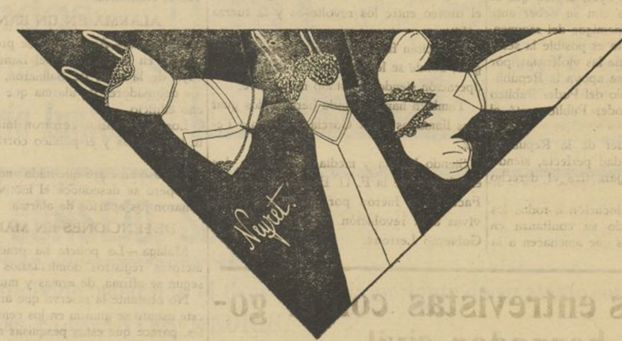
Camisa pantalón de seda con incrustaciones Luxenil.—Combinación en seda, con adornos de puntillas e incrustaciones de Venecia.—Camisón en jersey de seda indermallable adornado de bordado suizo y calados.