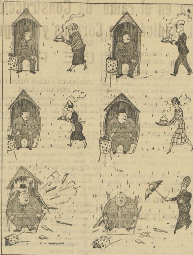
El guarda y los vecinos obsequiosos.