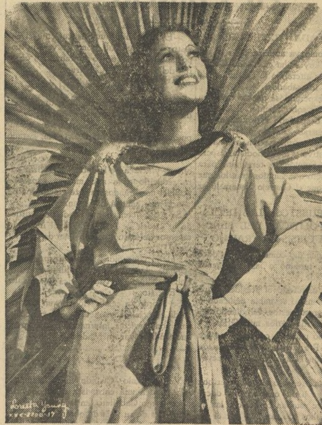
Loretta Young, ante un halo vegetal de palmeras, sonríe con su gesto más fotogénico de "star" triunfadora