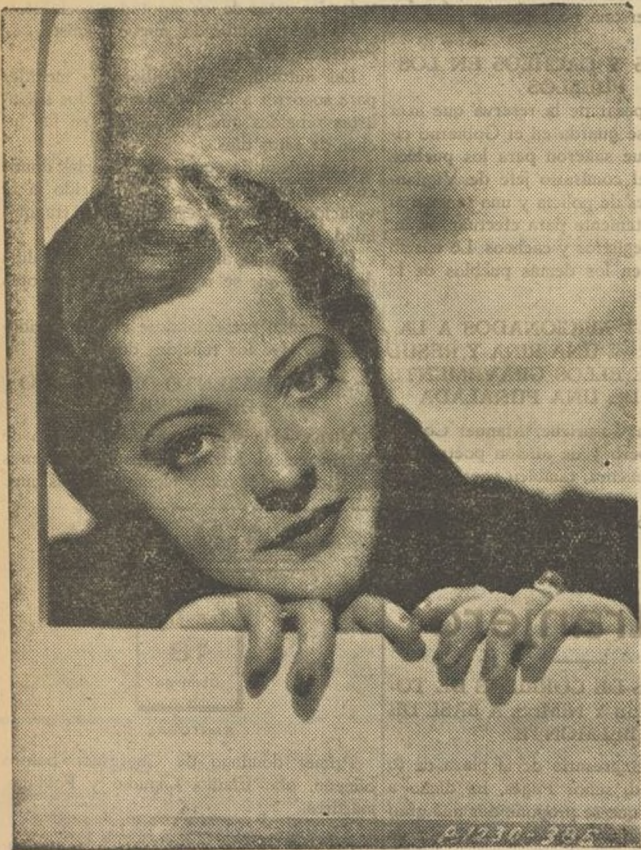
Sylvia Sydney, llena de belleza y gracia morena, en una posse pletórica de serenidad y dulzura