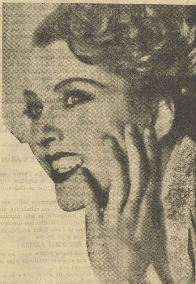
La bellísima Helene Robert, artista de delicada sensibilidad que constituye uno de los más altos valores del séptimo arte.

LA PROVINCIA publica durante la semana amenas e interesantes secciones