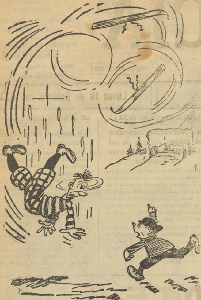
—¡Eh! ¿Que se deja usted los esquíes!