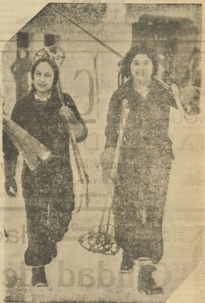
Dos intrépidas esquiadoras, bonitas como puede verse, de los miles de serranas que los domingos pueblan las nevadas del Guadarrama, luciendo sus dotes de patinadoras, andaliegas y elegantes atavíos.