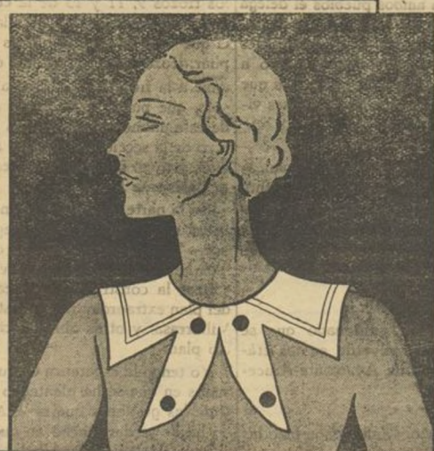
Cuello de piqué blanco cerrado delante por cuatro botones.

Han llamado mucho la atención los "tailleurs" de primavera de "taffetas" negro que moldean la silueta y acusan las formas. Estos van casi siempre acompañados, para dar una nota alegre, de blusas de "crêpe" o de "museline imprimée", verde, azul o rojo muy vivo. Las blusas de gruesa tela de hilo y aun las mismas de algodón, harán furor esta temporada de primavera.