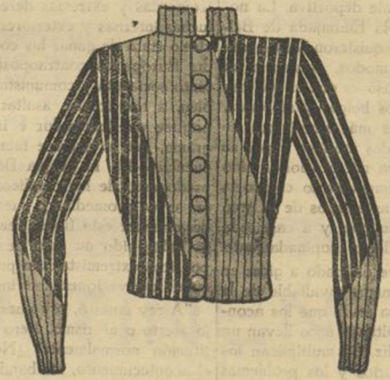
Balsin París 1934 Fig 1

Véase el modelo que a continuación publicamos.