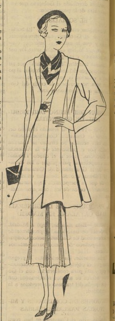
Modelo de Bernard para primavera, el abrigo corto es ancho y acampanado, así como las mangas.

Si esta es ligera, los baños de almíbar son muy eficaces, pero si tiene un carácter más agudo hacer fricciones de alcohol anforado y pulverizaciones de mentol.