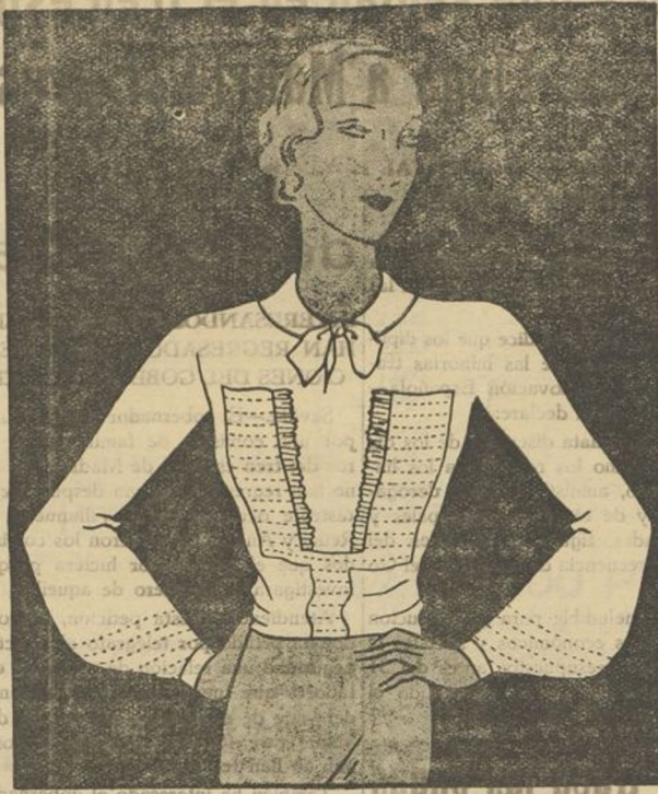
Blusa para acompañar un "tailleur" confeccionada en "crêpe satin" de seda blanca