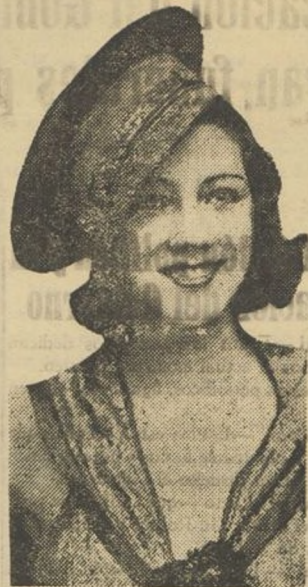
Tiple de gran valer que al frente de los elencos artísticos del popular maestro Guerrero ha cosechado durante la pasada temporada teatral aplausos prodigados unánimemente por el público madrileño.