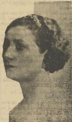
Blanca Podestá, la gran actriz dramática argentina que por primera vez va a erigirse ante el público español donde le auguramos notables éxitos como actriz si sabe elegir el repertorio adecuado, olvidándose un poco de los "conventillos", "gringos", "gallegos" y demás obligados temas del teatro argentino.