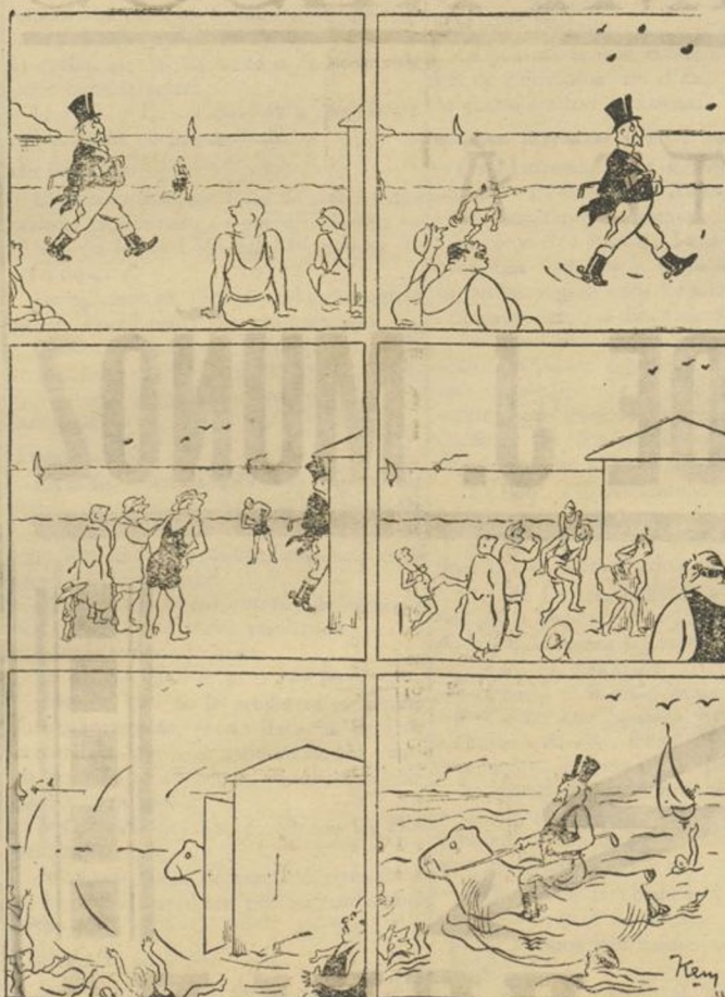
EL AÑO DEL GENERAL