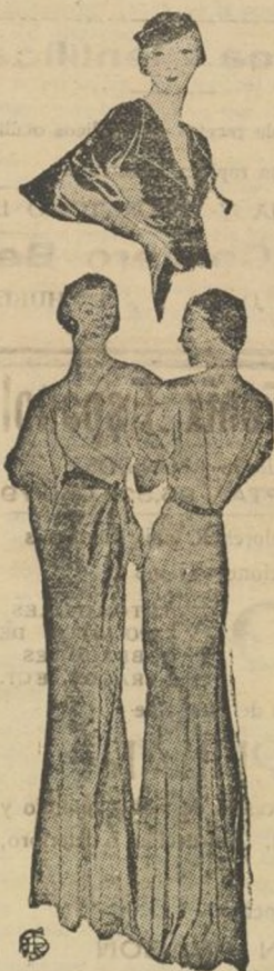
Modelos para asegurar el triunfo del eterno femenino

Señoras, no dejen de leer mañana nuestra sección que le dedicamos, pues verdaderamente si es usted mujer elegante, le interesa.