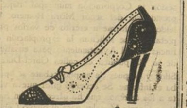
Zapato para traje de mañana