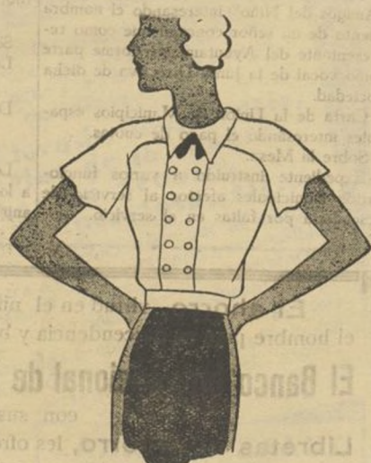
Blusa de "crépe" blanco para llevar con un abrigo, para la tarde y blusa de "crépe marocaine" azul claro, con botones de cristal negro.