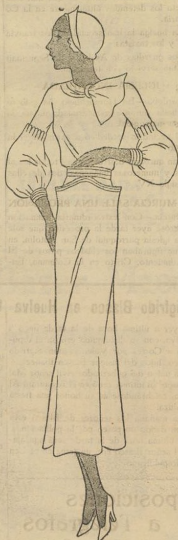
Traje en "étamine" de hilo natural

En un gran vaso de cristal: Unos pedacitos de hielo. Ocho gotas de Curacao. Un cuarto de limón exprimido. Ocho gotas de jarabe de fresa. Una copa de Seagers Gin. Agítense bien y sírvase en copa de coctail con una fresa.