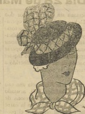
Modelo de sombrero para llevar con un vestido oscuro para la hora del thé. Gran lazo en "taffetas" a cuadros