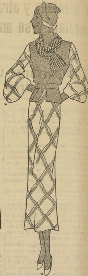
Traje "après-midi" en lana con dibujo de cuadros azules. El echarpe blanco y azul marino oscuro

Limpiarlos con espíritu de vino. El agua de lejía os dará igualmente buenos resultados.