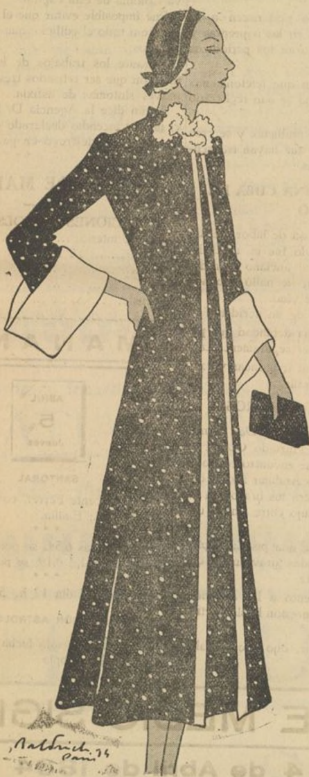
Modelo de abrigo de entretiempo, gran fantasía en "crêpe-satin" salpicado. Los puños corbata, y vueltas en tonos claros lisos.