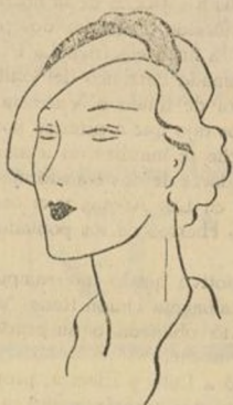
Toca de paja negra y blanca, con adorno de cinta verde claro.

Contra la aspereza de las manos lavarlas con agua jabonosa añadiéndole agua