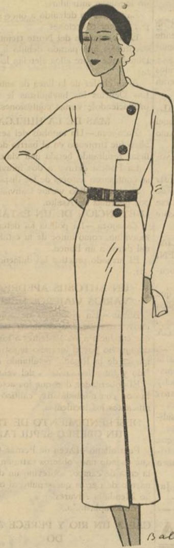
Modelo de abrigo ligero para verano en gris claro con botones y cinturón fantasía.