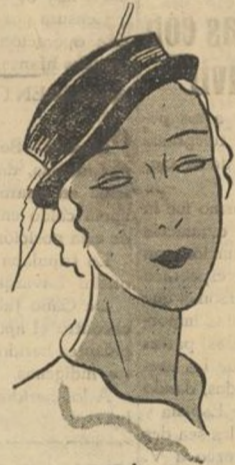
Sombrero de paja negra con adorno de pluma cuchillo.