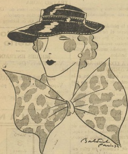
Sombrero modelo Marie Guy, de charol negro.