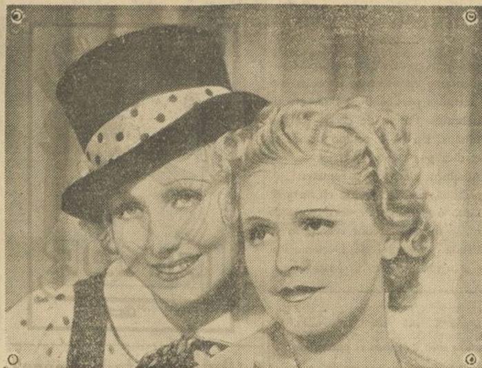
Dos rubias deliciosas—una de ellas Liane Haid—que intervienen en la nueva película "Dime quien eres tú?"