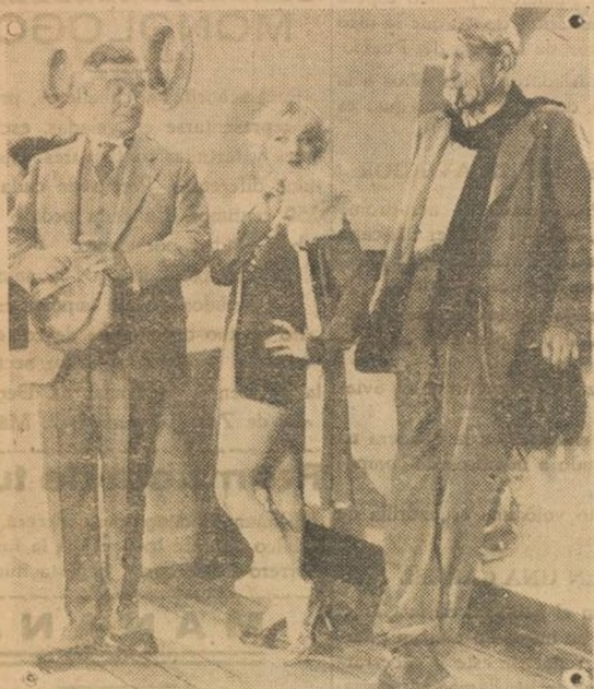
Una escena de la película "Falsas Fiebre" estrenada recientemente en el Cine Capitol de Madrid con un gran éxito.