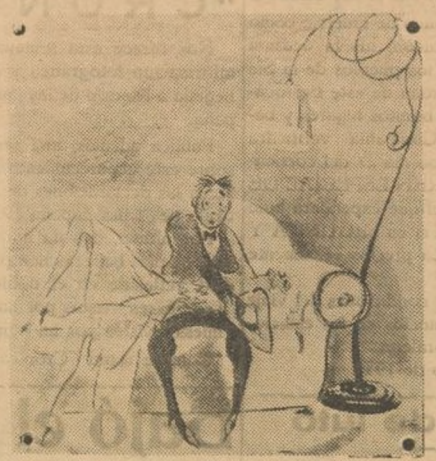
Y siempre, precisamente, en este instante dejan de rodar.