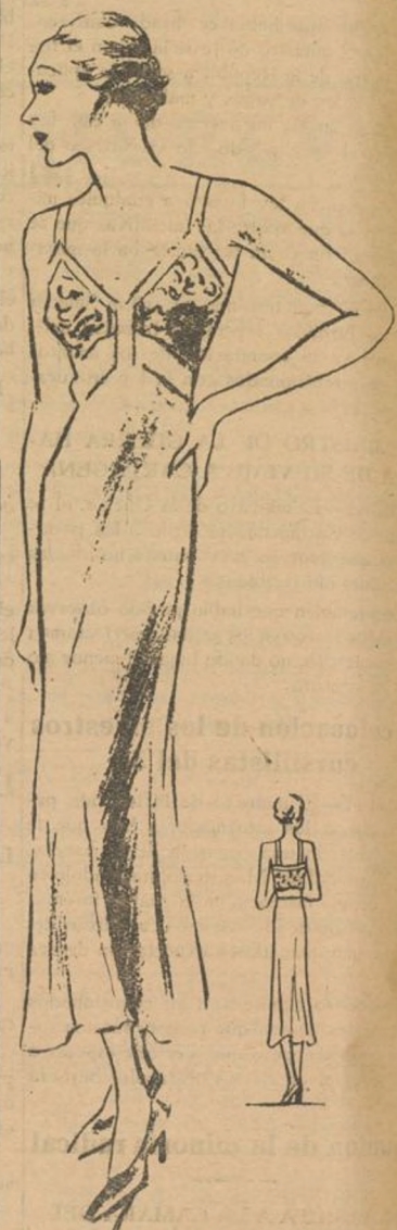
Combinación en "crepe" de china y encaje

...que los aretes de azahar vuelvan a estar muy de moda.