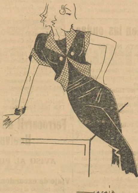
Modelo muy a propósito para deportes en azul marino y cuadritos en rojo.