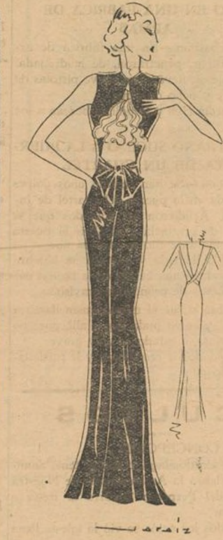
Vestido de noche con el cuello completamente cerrado por arriba, mientras que por abajo, se abre grandemente, dejando al descubierto un original adorno en organdi.

Deberá, pues, en un caso de estos, hacer observar el niño por un médico y por un cirujano; incluso si en su primer examen todo parece negativo conviene insistir y no abandonar al niño en la creencia de que