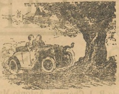
Imagínese lo que sentiré que sus lecciones tengan fin.