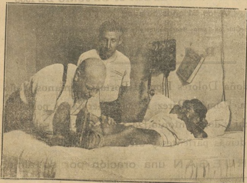
LA POCA FORTUNA DE TRUEBA

Las máquinas se clasificaron de la siguiente manera: Primero.—Lázaro. Segundo.—Cataluña. Tercero.—Orbea. Cuarto.—Sestel.