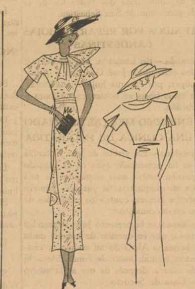
Un traje estampado del que puede indicarse como nota especial del vestido la línea tan sencilla como elegante. Creación "Jerommé"

Hágase que, después de lavados los trapos de cocina, hiervan durante media hora en esta agua, enjuáguelos luego en agua caliente, y póngaselos a secar al sol.