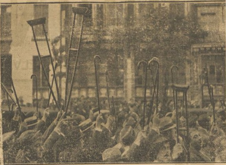
Un gran número de mutilados de la guerra, se han manifestado contra la decisión del Gobierno francés, de reducir sus pensiones. En nuestra fotografía aparecen los mutilados, levantando bastones y muletas en señal de protesta.