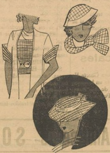
Las telas escoceses se admiten esta temporada para adornar "ensembles" para playa y campo. He aquí la manera de adornar un traje y un abrigo que se puede llevar con sombrero o gorrita.

El velo de tul cortado en tres partes, dos saliendo sobre los hombros y una más pequeña en la cabeza permiten una nueva inspiración de las flores de azahar.