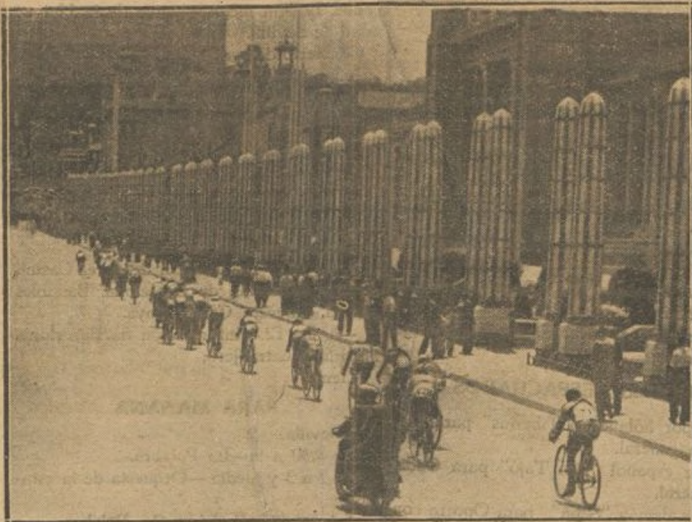
El ciclismo es un deporte que cada día va adquiriendo más incremento en nuestro país, siendo la región donde cuenta con más adeptos Cataluña. Véase en la fotografía la subida de un pelotón por la Gran Avenida de la Exposición de Barcelona, en una gran carrera recientemente celebrada.