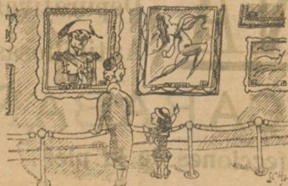
—Di, mamá: ¿y esa también perdió algo en Waterloo?