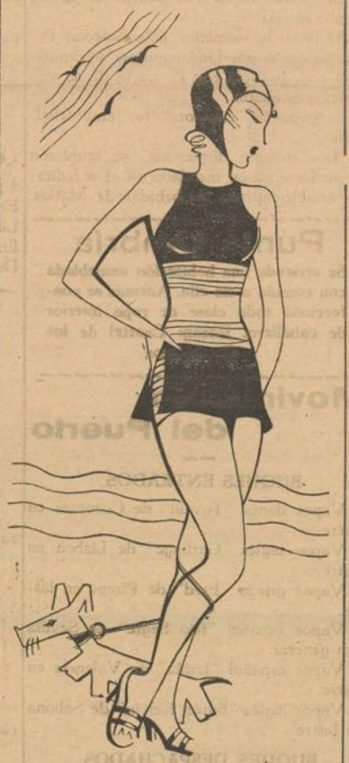
El "maillot" se transforma y se hace cada día más reducido.