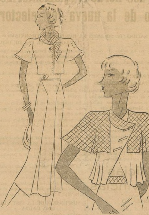
Trajecitos de sport confeccionados en lana