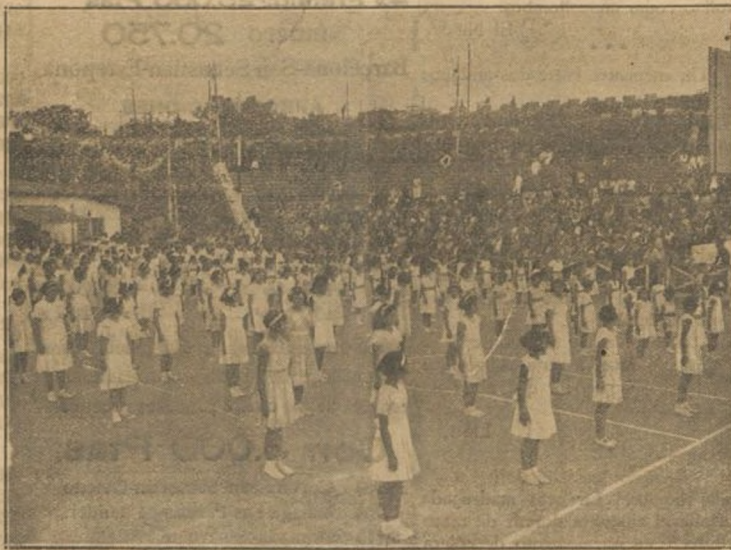
La educación física de los niños, en su parte espectacular de ejercicios gimnásticos realizados en conjunto, entra ya a formar parte de los programas de fiestas. Ved aquí a estas niñas que tomaron parte en el festival infantil que se celebró en Barcelona, por la colonia francesa, para conmemorar la fiesta del 14 de Julio.