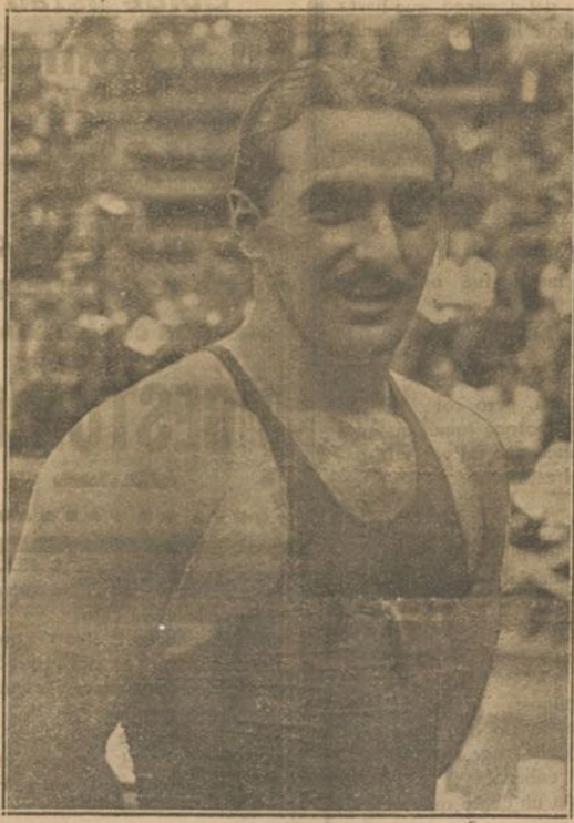
CAMPEONATO DE CATALUÑA DE NATACION

Libretas de Ahorro, les ofrece el medio seguro de conseguir su fin abonándole el 3 y medio por 100 de interés anual. Este Banco realiza toda clase de operaciones bancarias.