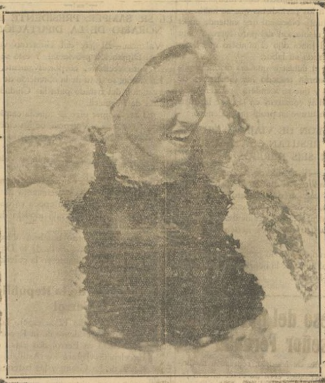
La presente "foto" no reproduce a ninguna "star" de Cinelandia en una de sus poses favoritas. Es simplemente la nadadora holandesa Willie den Ouden que ha batido un record de natación en los Juegos Olímpicos de Los Angeles. Pero ¿no es verdad que puede muy bien parangonearse en cuanto al físico con cualquiera estrella de Hollywood? Por eso no hemos dudado en publicar su "foto" en esta sección.

Fuero la mañana entran juntos en los Estudios de la "Universal-City" y por la tarde salen del guardapropas ambos del brazo. Cuando sus labores coinciden y terminan el trabajo, Sidney se coge del brazo de Murray y éste de aquel y con sus mujeres y la hija de Murray salen en el auto de cualquiera de los dos a hacer pequeños viajes. Sidney le ayuda a Murray de todo corazón en la escena y en la vida Murray le ayuda a Sidney con toda su alma lo mismo en la calle que en la pantalla.