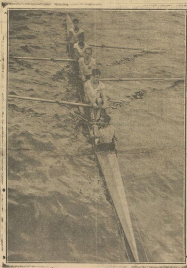
Esta prueba del campeonato de España, se la adjudicó el "Osiris" del Club Marítimo de Barcelona, en siete minutos y 32 segundos, en ruda lucha, con el "Tarragona" del Club Náutico de Tarragona, que llegó en siete minutos 33 segundos.