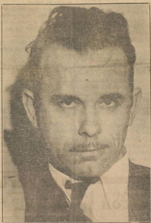
De la muerte del enemigo público n.º 1 de los Estados Unidos

Moscú.—En las excavaciones efectuadas por la Academia de las Ciencias en el valle de Zevacatan, se encontraron granos de cebada que se calcula hayan estado enterrados durante unos 1.200 años. A título de experimentación, se han sembrado algunos de dichos granos que han germinado normalmente.