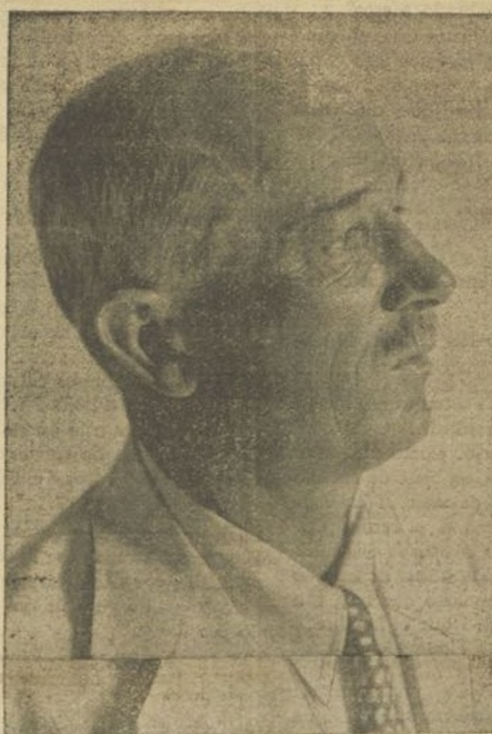
LA ENFERMEDAD DEL PRESIDENTE MASARYK

El ministro de Relaciones Exteriores, Mr. Eduardo Benes, que según se cree en los círculos políticos, ocuparía la Presidencia de Checoslovaquia en caso de fallecer el actual presidente