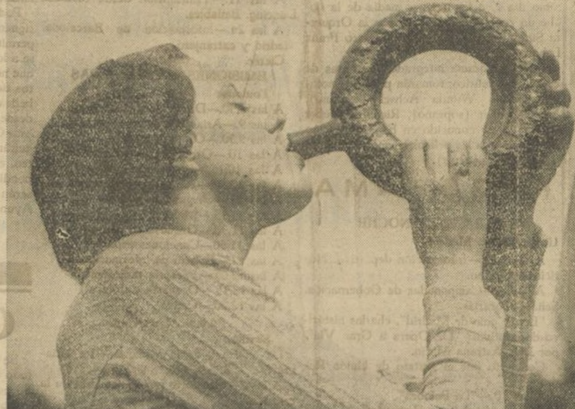
EN HONOR DE LA DIOSA FORTUNA