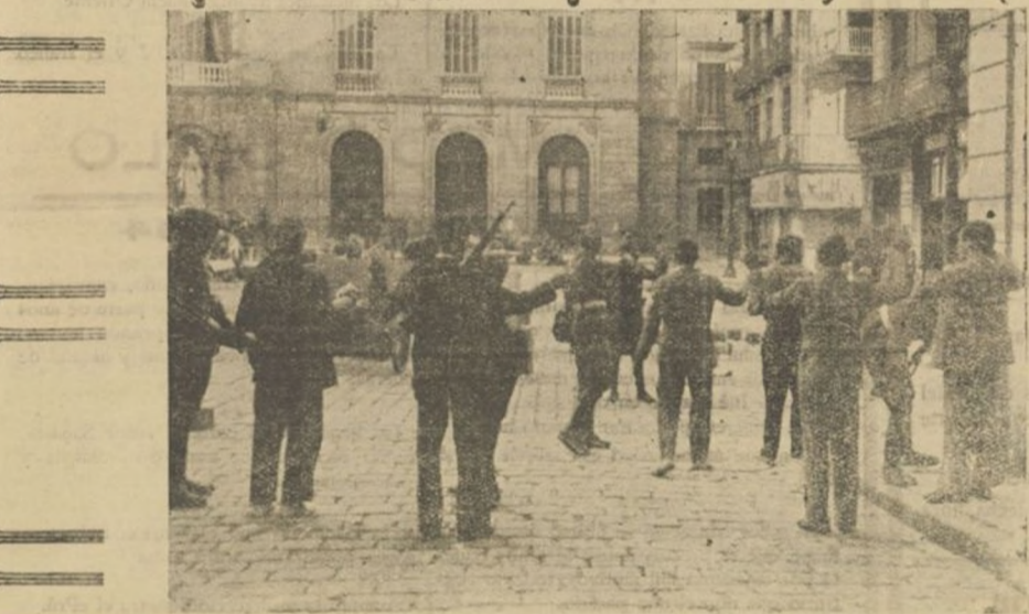
A la izquierda: Cacheos en la Plaza de la República después de haber sido tomada por las fuerzas del ejército. A la derecha: Balcones del Ayuntamiento destruidos a cañonazos.