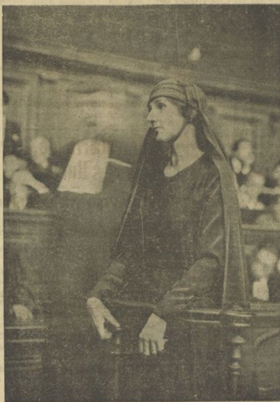
DEL PROCESO DE VIOLETTE NOZIERE