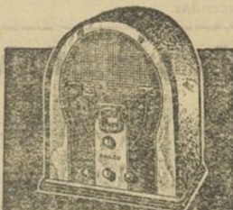
Modelo 60 onda normal 5 válvulas