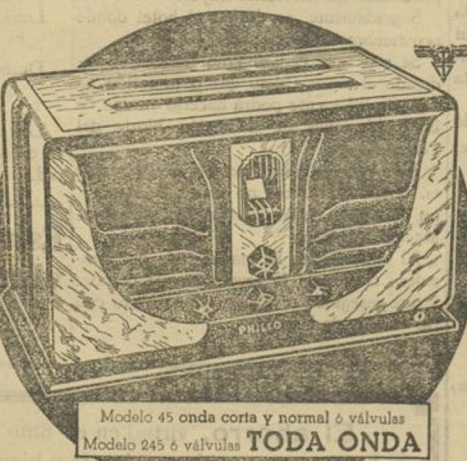
Modelo 45 onda corta y normal 6 válvulas. TODA ONDA

a cuantos pueda interesar los adelantos en radio-receptores oir nuestros aparatos y comprobar su rendimiento y la fidelidad máxima de reproducción que poseen, además de lo razonable de sus precios, calidad sin competencia debido únicamente a nuestra enorme producción. La fabricación de la PHILCO representa el 55 por ciento de la producción total americana.