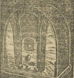
Modelo 118 onda corta y normal 8 válvulas. Modelo 218 toda onda 9 válvulas