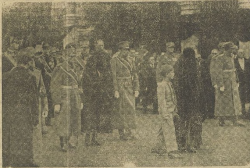
EXEQUIAS DEL REY ALEJANDRO DE YUGOSLAVIA EN BELGRADO

El cortejo fúnebre en las calles de Belgrado. La reina María de Yugoslavia y el pequeño rey Pedro II ostentando el uniforme de sokol, seguido del príncipe regente Pablo y de la princesa Olga. Algo más lejos puede reconocerse al rey Carol, de Rumanía y al príncipe Jorge de Inglaterra.