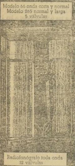
Modelo 245 6 válvulas