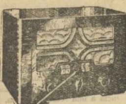
521 A.—SUPER-OCTODO, corriente alterna, ondas cortas y largas.