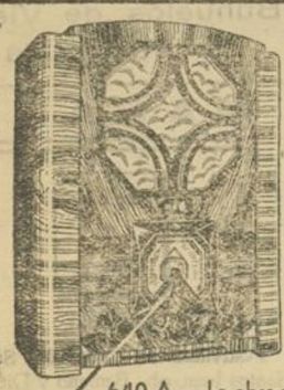
640 A.—La obra maestra de Philips en receptores de radio. Cuatro circuitos a SUPERINDUCTANCIA, corriente alterna, ondas cortas y largas, antena incorporada. Sintonización óptica con escala de emisoras Micro-Index intercambiable.