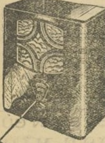
736 A.—Tres circuitos a SUPERINDUCTANCIA, corriente alterna, ondas cortas y largas.