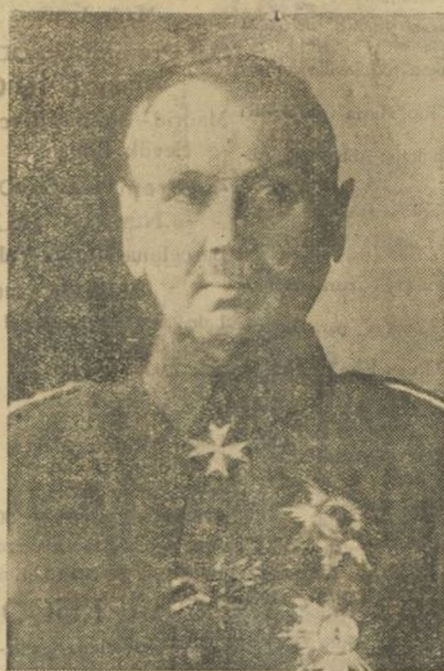
MUERTE DE UNA GRAN FIGURA DE LA GUERRA

El general Von Kluck, que mandaba los ejércitos alemanes en la batalla del Marne, la batalla que decidió el resultado de la guerra que acaba de fallecer en Alemania.